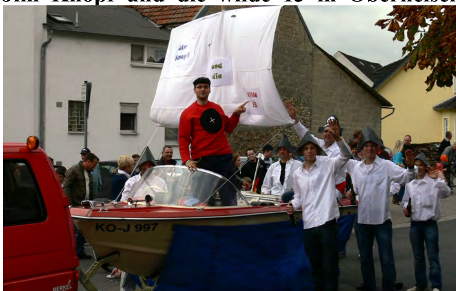
Der Kirmesumzug in Oberneisen stand in diesem Jahr unter dem Motto „Augsburger Puppenkiste“. Die Feuerwehr war u.a. als Jim Knopf und die Wilde 13 unterwegs.

Das Innenministerium lobt erneut, wie MdL Frank Puchtler mitteilt, den rheinland-pfälzischen „Ehrenamtspreis für herausragende kommunale Projekte“ aus. In Rheinland-Pfalz engagieren sich ca. 1,4 Millionen Bürgerinnen und Bürger aller Altersklassen in den verschiedenen gesellschaftlichen Bereichen. Dabei liegt der Schwerpunkt des Engagements des Einzelnen in seiner Heimatgemeinde. Dies soll mit dem Kommunalen Ehrenamtspreis anerkannt und auch in Form einer Ideensammlung landesweit bekannt gemacht werden. Teilnahmeberechtigt sind alle rheinland-pfälzischen Kommunen, die erfolgreich ein Projekt im Ehrenamtsbereich entweder selbst initiiert haben oder ein solches Projekt vorbildlich unterstützen, sei es finanziell oder ideell. Der Preis ist mit insgesamt 14.500 Euro dotiert und staffelt sich wie folgt: 1. Preis 5.000 Euro; 2. Preis 3.000 Euro; 3. Preis 2.000 Euro sowie Sonderpreise für Projekte aus dem Jugend- und Frauenbereich sowie für Kommunen mit einer Einwohnerzahl unter 500 für ein herausragendes Projekt, das dem Wohl einer großen Zahl von Menschen in der Kommune dient und das Breitenwirkung in die Kommune hinein entfaltet.